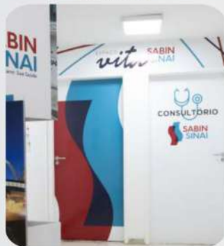
ESPAÇO VITA ALBERT SABIN