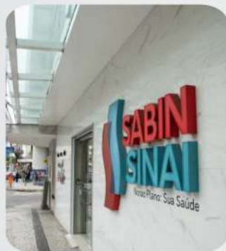
ESPAÇO VITA CENTRO